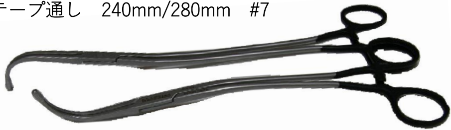
上からのアプローチにぴったりなカーブ