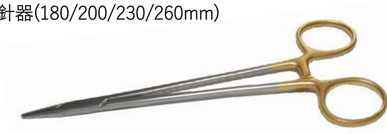
D/D・・・ダイヤモンド ダスト コーティング